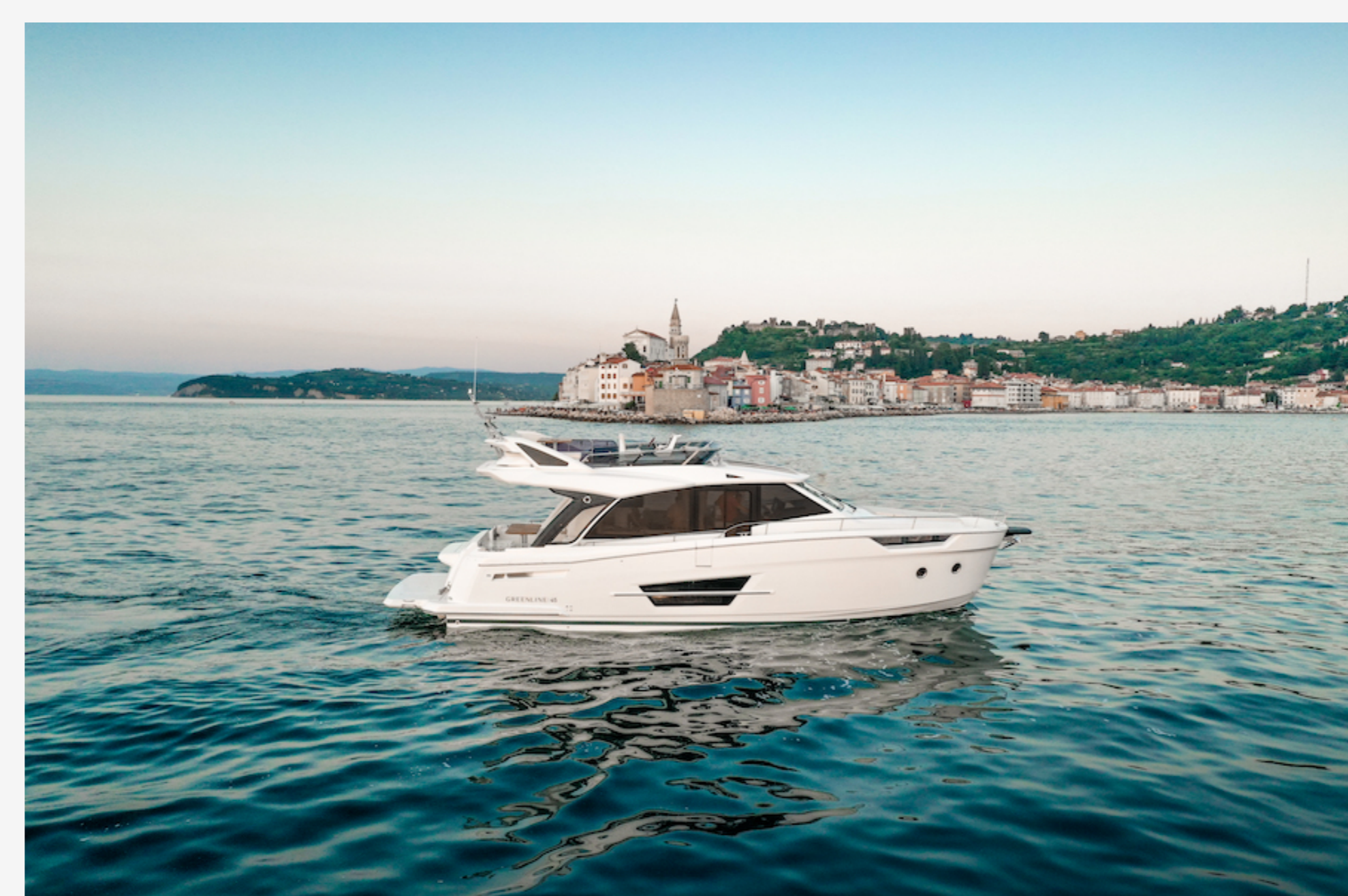
GREENLINE 45 FLY

La combinazione di pannelli solari, un motore elettrico in linea e inverter/caricabatterie fa sì che 230V AC sia sempre disponibile senza la necessità di ricorrere ad un generatore rumoroso. A cinque nodi si può navigare per oltre 30 miglia nautiche senza emissioni, ideale per quando si devono percorrere brevi distanze o si è in porto e si deve ormeggiare.